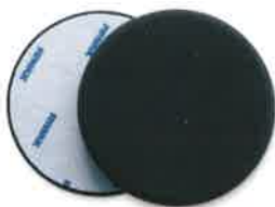
POLIERSCHWAMM SCHWARZ (SOFT) 175 x 30mm