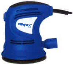
RANDOM ORBITAL POLISHER 125mm